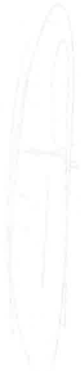
Diagram illustrating the structure of a tree trunk, showing the pith, primary xylem, secondary xylem (growth ring), and secondary phloem.